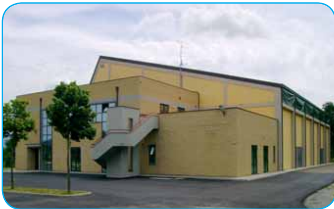
La sede di ECO CENTER presso il palazzetto dello sport di Anghiari in via Fausto Coppi

in maniera professionale (guidata) e razionale significa ridurre l'usura naturale dell'apparato locomotore, ridurre e ritardare tutte quelle patologie muscolo-scheletriche collegate all'avanzare dell'età (osteoporosi, artrosi artriti...), pertanto il movimento risulta essere il "farmaco" più efficace a minor costo. La sinergia è presto creata: il Comune di Anghiari mette a disposizione il trasporto degli utenti, l'Ecocenter si occupa della gestione dell'attività fisica adattata per anziani.