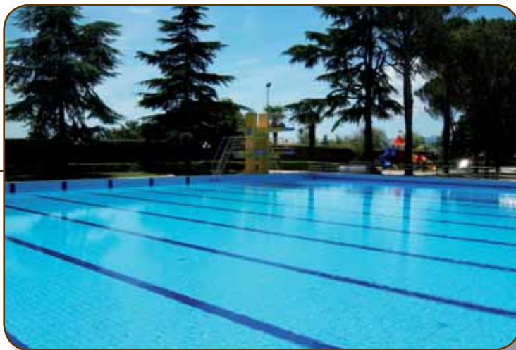
La VASCA PRINCIPALE delle PISCINE DI SANSEPOLCRO