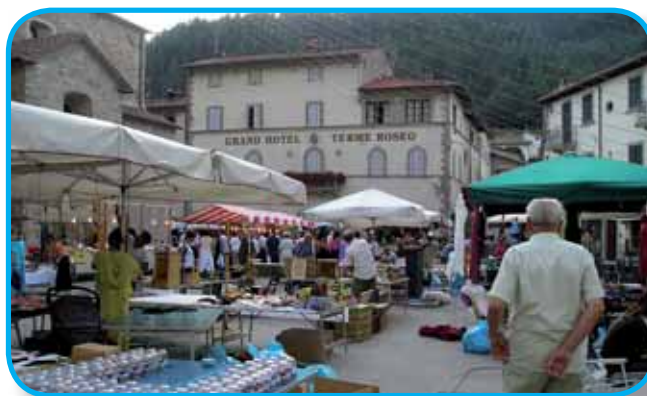
LA FIERA DEL MARTEDÌ a Bagno di Romagna

e tradizionale o rappresentano particolari tipologie, vedi bigiotteria, libri, stampe artistiche, tele stampate, ceramiche artistiche, erboristeria e piante officinali, fiori secchi, vetri e vasellame. Il tutto condito da animazioni varie, non dimenticando la possibilità offerta di ammirare il centro del paese, e fare un salto alle mostre d'arte di Palazzo del Capitano e della Loggetta Lippi. E il successo che riscuote la "Fiera del Martedì" è testimoniato dalla grande novità di quest'anno: l'allungamento del periodo fino al 28 settembre, per un totale di 16 appuntamenti. Bagno di Romagna e il suo mercatino attendono dunque i graditi ospiti nelle serate dei seguenti giorni: 15, 22 e 29 giugno; 6, 13, 20 e 27 luglio; 3, 10, 17, 24 e 31 agosto; 7, 14, 21 e 28 settembre.