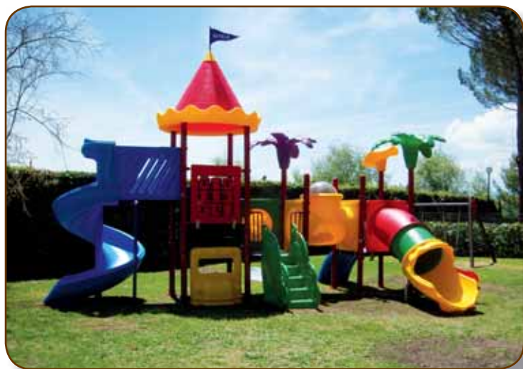
Il CASTELLO DI ALADINO nell'area riservata ai più piccoli delle PISCINE DI SANSEPOLCRO